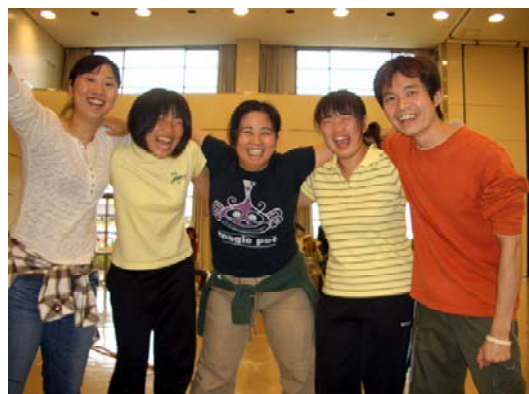
グループホーム運動会にて